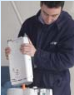
Dispositif médical d'aide respiratoire.

L'offre du Groupe couvre non seulement la fourniture d'oxygène et des matériels adaptés , mais aussi de nombreux services : souplesse et rapidité d'intervention, service d'urgence 24 heures sur 24, gestion du dossier administratif, formation du patient et de son entourage, le tout en étroite collaboration avec les intervenants médicaux, paramédicaux et les organismes de remboursement. En France, Air Liquide accompagne également les patients diabétiques avec la mise à disposition de pompes à insuline, une activité en très forte progression. Enfin, l'offre du Groupe s'étend aussi à d'autres prestations comme la perfusion et la nutrition entérale (via l'oesophage ou la paroi abdominale).