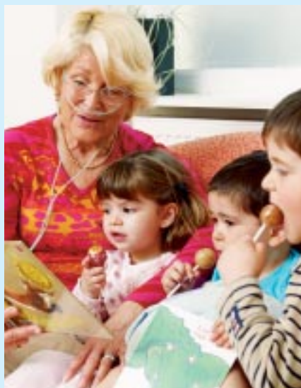
Soins à domicile

Le dynamisme des activités Électronique aux Etats-Unis et Clients Industriels au Canada, ainsi que la progression des ventes en Amérique du Sud ont également contribué à cette performance.