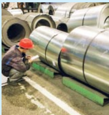
Acierie Severstal en Russie

Les résultats nets ajustés des éléments que nous considérons comme exceptionnels et significatifs, suite notamment à l'introduction des normes IFRS, sont de 812 millions d'euros en 2004 et 900 millions d'euros en 2005, soit une croissance de +10,9 % .