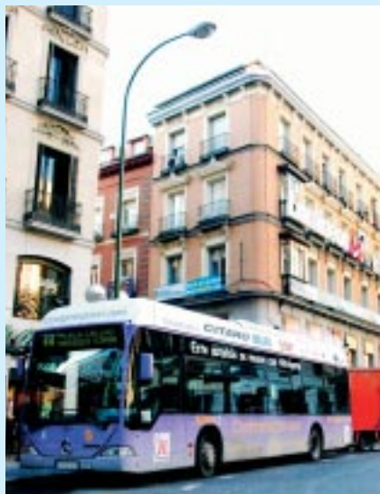
Bus hydrogène à Madrid

et de la solidité de la performance du Japon. Les activités Clients Industriels et Grande Industrie enregistrent une progression à deux chiffres de leurs résultats.